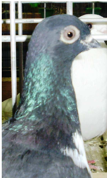
6. sz. kép

A lenti képen látható egyed a 2011-es Nemzeti Kisállat Kiállításon volt bemutatva. A világos írisz és szembőr hibaként szerepelt a bírálati lapján.