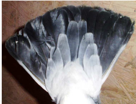
18. sz. kép: Kíváncsiaként említendő támasztótoll