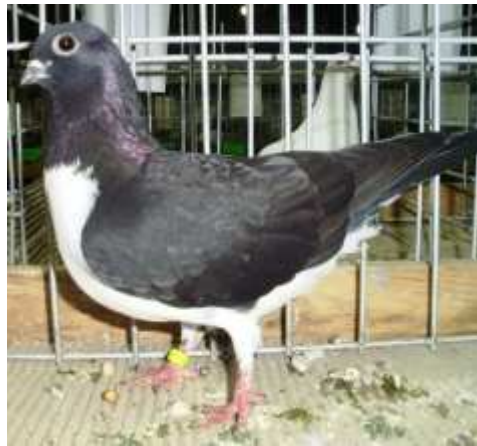
1. sz. kép: magas állás

A gyakran jelentkező magasabb állás és meredekebb testtartás nem kívánatos, hiszen e tulajdonságok az ó-osztrák keringőre jellemzőek. Bírálatkor is kifejezetten kell rá figyelni. Az alábbi képen látható budapesti bíbic keringő testtartása megfelelő, ugyanakkor túl magas állású. Az ilyen egyed szükség esetén még továbbtenyészhető.