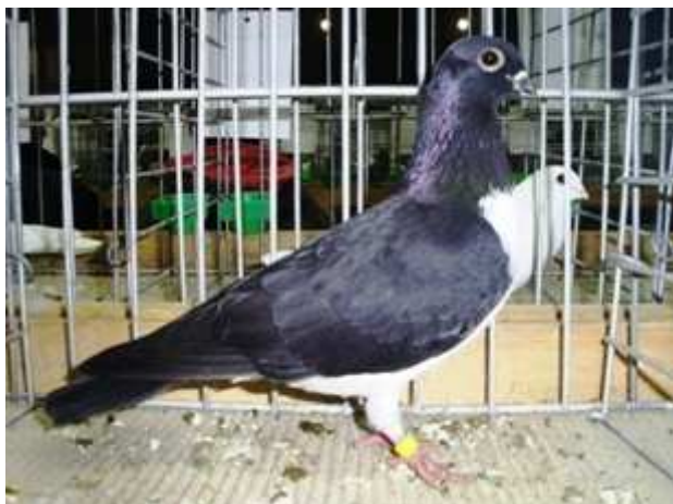
20. sz. kép: A fajtagyőztes hím