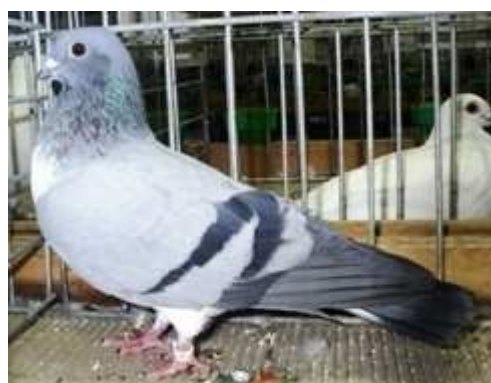
21. sz. kép: A fajtagyőztes tojó

Kívánalmak: Nem eléggé intenzív szín, túl kicsi test, enyhe rajzhibák, húzott homlok.