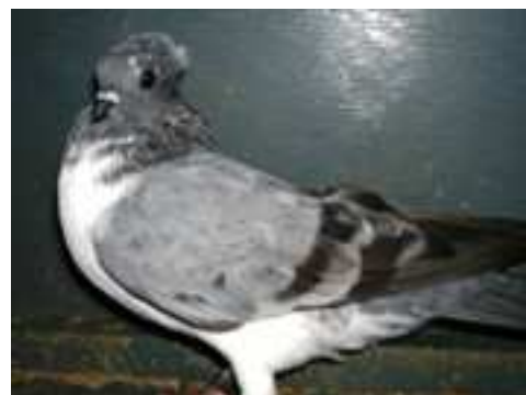
3. sz. kép: fésű