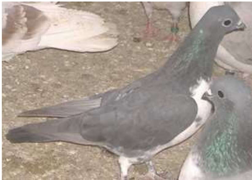
8. sz. kép

A rajz mellett a színnel van a legtöbb probléma. A feketék színe legtöbbször nem elég intenzív, matt színű. E hibát csak szigorú szelekcióval sikerülhet orvosolni.