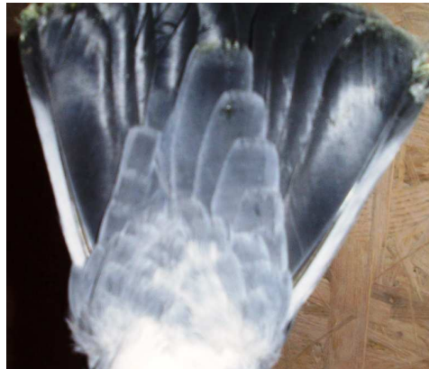
19. sz. kép: Ez a támasztótoll közelít a standardban meghatározotthoz.

A színnél említettem a fiatalkori szín jelentőségét. A nem deres fiatalok első vedlés után 100%-ban színes háttal és támasztótollakkal rendelkeznek! Az ilyen példányok rajza általában a mellen is jobban közelít a standardban meghatározott vonalhoz, mint azoké, amelyek fiatalkorban deresek voltak!