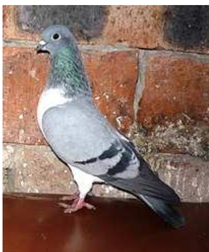
7. sz. kép

Mell: Széles, jól izmolt, csak kissé emelt, mérsékelten előredomborodó. A magasan, nem vízszintesen álló egyedek melle túlságosan emelt, kevésbé széles. Az ilyen példányok továbbtenyésztése nem ajánlott.