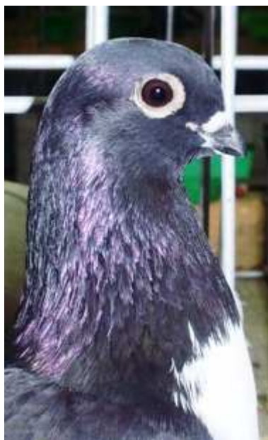
5. sz. kép