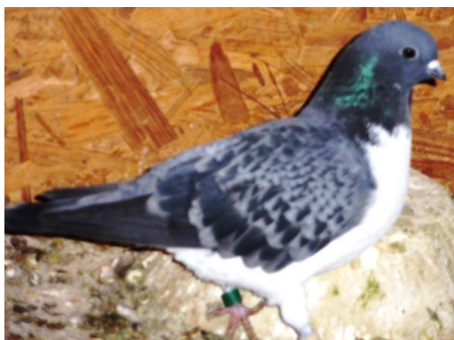
11. sz. kép: kovácsolt kék tojó saját állományomból.

Kitenyésztés alatt álló – már létező – szín és rajzváltozatai (állomány nagyság szerinti sorrendben): kékkovácsolt, vörös, sárga, kékfakó, olajbarna és olajbarna-kovácsolt. Utóbbi két szín- illetve rajzváltozatról sajnos nem rendelkezem képpel.