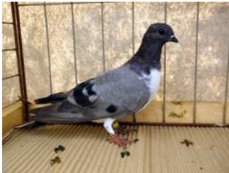
10. sz. kép

Bár az alábbi egyed valamivel idősebb, és már vedlik a különbség így is látható.