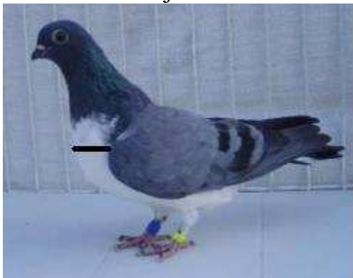
16. sz. kép: ideális rajzhatár