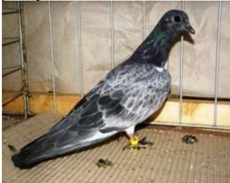
9. sz. kép

A szalagos kék színváltozatnál a szín mélysége, teltsége gyakran egy tenyészetben belül egyedenként is változó. A fiatal egyedek az első vedlésig általában deres színűek. A vedlés után nyerik el végső színüket. Az alábbi képen látható fiatal egyed még kissé deres színű.