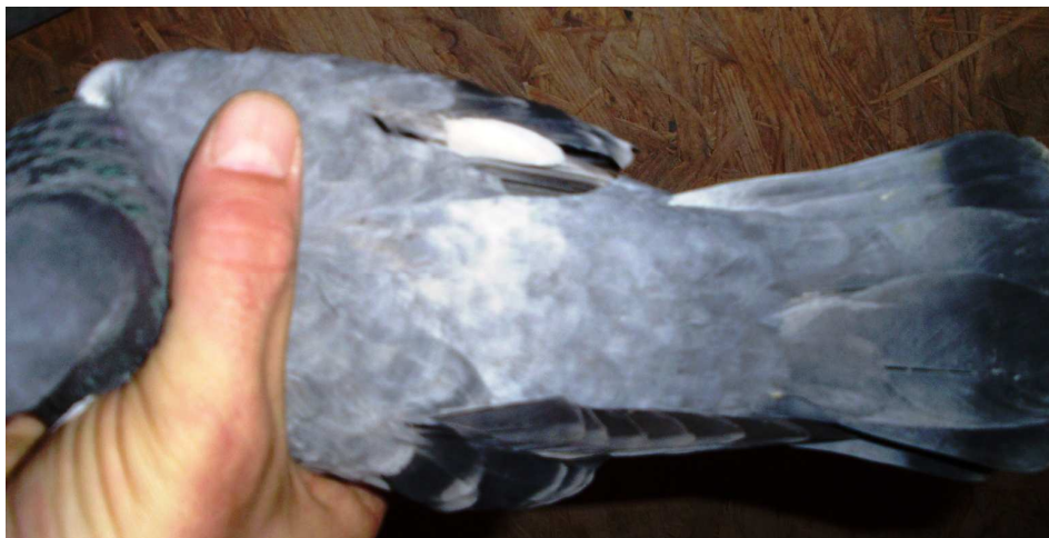
17. sz. kép