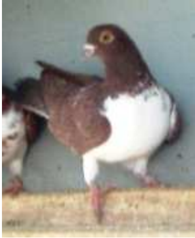
13. sz. kép: egy minőségileg jobb egyed Szarka János állományából